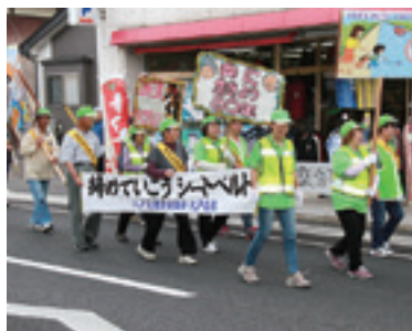
総務費は交通安全運動にも活用（交通安全パレード）

目的別では、総務費（住民サービスや一般事務経費）が7億8,904万円となり、全体の19.7%でトップ。次いで、民生費（福祉対策や保育園などの経費）が7億8,672万円と続き、全体の19.6%となっています。