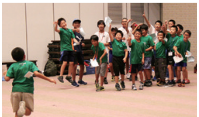
ミニゲームで交流を深めた児童