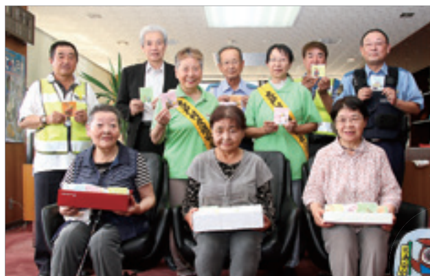
交通安全を願い星に託しました(右下はキーホルダー)