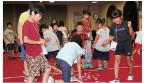
アルファベット探しゲーム

2部は3日間とも、いきいき宿題タイムが行われ、持参した夏休みの宿題に取り組みました。この時間は、伊保内高校の生徒8人による学習サポーターに教えてもらいながら、宿題を進めることができました。