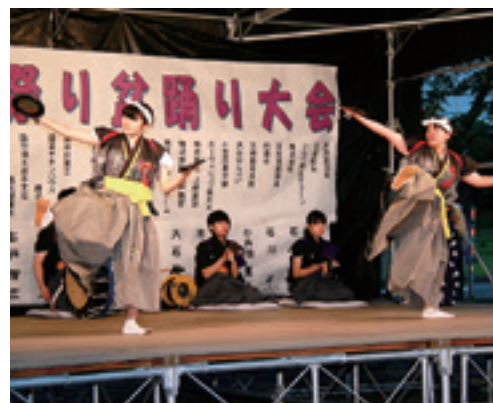
伊保内高校郷土芸能委員会が「盆舞」を演舞

ステージイベントの後は、盆踊りと大抽選会。盆踊りに参加した人に抽選券が配布されました。子どもや住民、帰省客などが大きな輪を作り、ナニヤドヤラを踊りました。おしとやかに踊ったり、はつらつと踊ったりと一面に笑顔が広がっていました。また、人気ゲーム機が当たる大抽選会も開かれ、抽選のほかに「目立つ