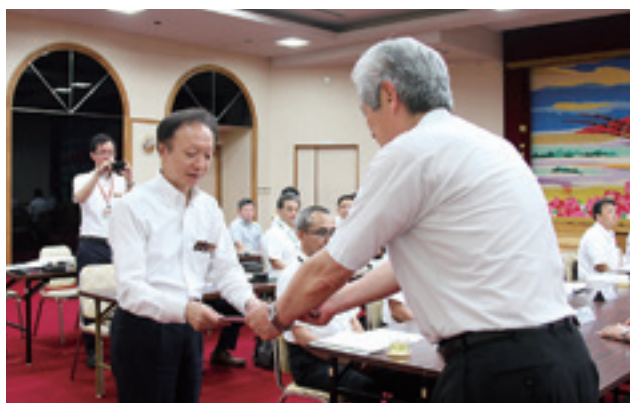
南振興局長(左)に要望書を手渡す五枚橋村長

要望書には、九戸地域診療センターの医療体制充実、国道340号線の歩道・改良整備について、県立伊保内高等学校の存続についてなど6点が掲載されています。