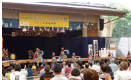
多くの観客の前で圧巻の演舞を披露

「ほかの学校の演舞も迫力がありました。広島は神楽が盛んなところだ。今年も多くの観客の前で圧巻の演舞を披露