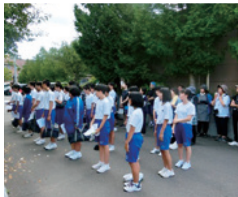
親子で奉仕作業をし環境整備に努めました

九戸中学校3学年は、親子行事として地域のボランティアアを行いました。親子で、社会福祉センターの廊下にワックス