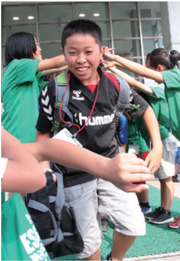
六戸町の児童がアーチで見送ってくれました

六戸町に到着した一行は、同町の子どもたちに出迎えられ、交流会に参加しました。児童たちは、4つのグループに分かれ1日の行動を共にしました。