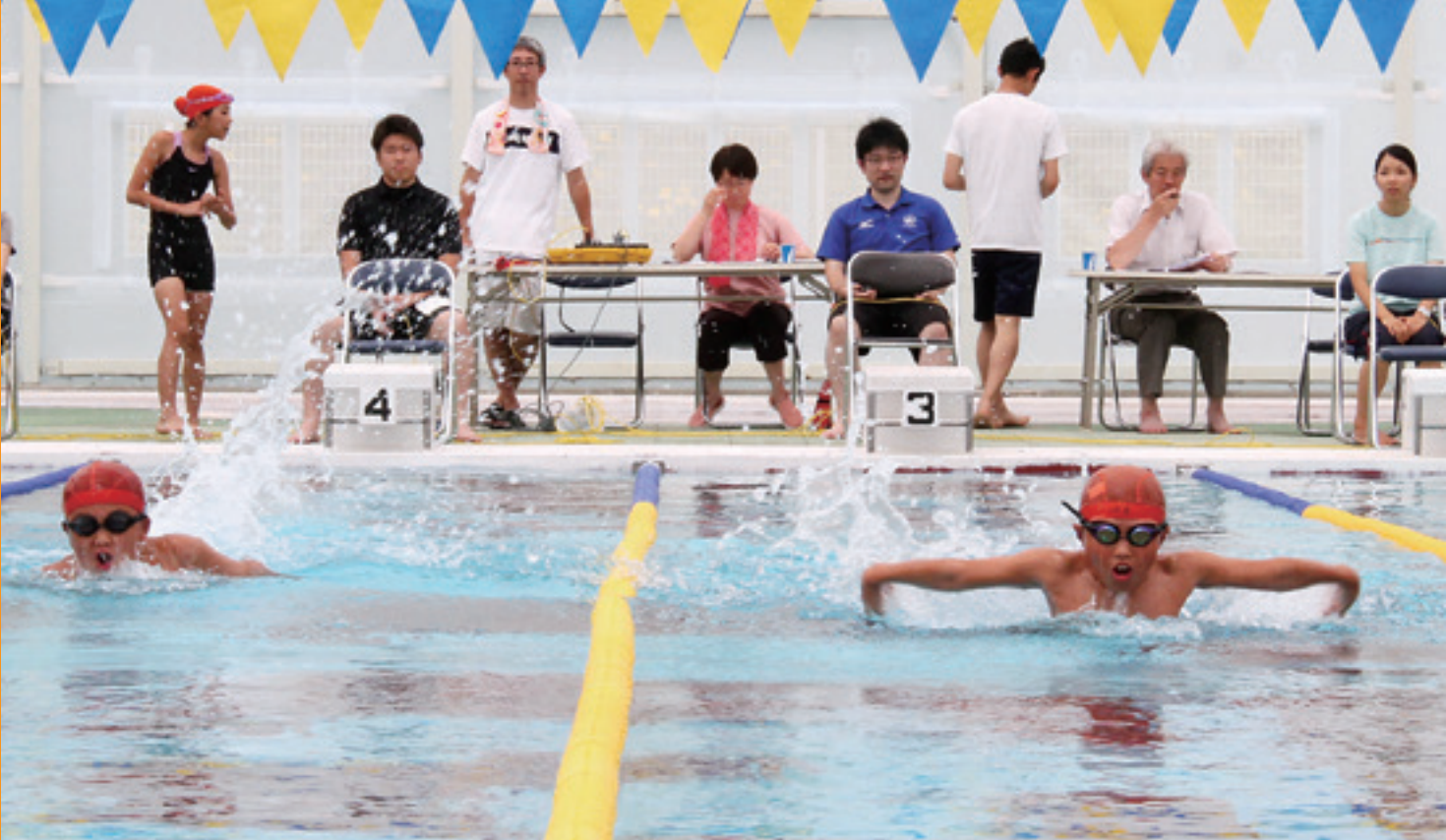
接戦が繰り広げられたバタフライ