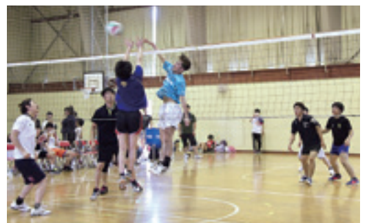
↑男子バレーでは迫力の攻撃戦が展開 ↓力投をみせる戸田2区の選手(野球)