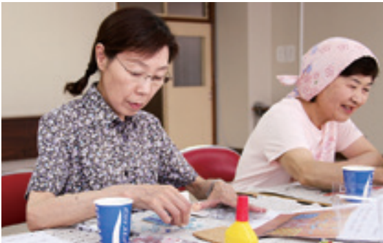
完成したイメージを想像しながら配置