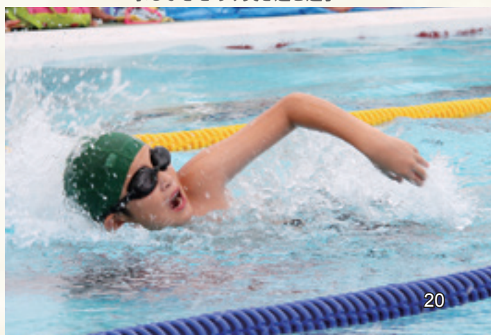
水しぶきをあげ突き進む選手