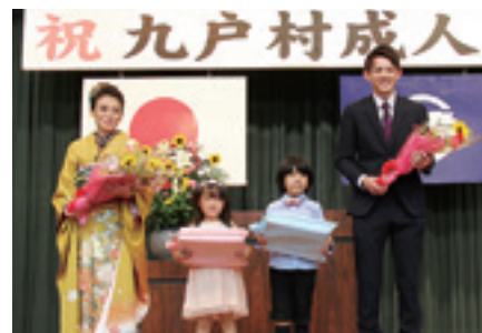
園児から花束が贈られました

8月15日、HOZホールで成人式が挙行されました。平成11年4月2日から平成12年4月1日生まれの52人が成人を迎え、当日は45人が出席しました。