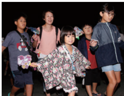
子どもから大人まで楽しんだ盆踊り

たで賞」や「浴衣が似合っていたで賞」などさまざまな賞が参加者に贈られていました。