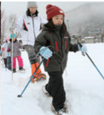
かんじきで雪を歩く児童たち