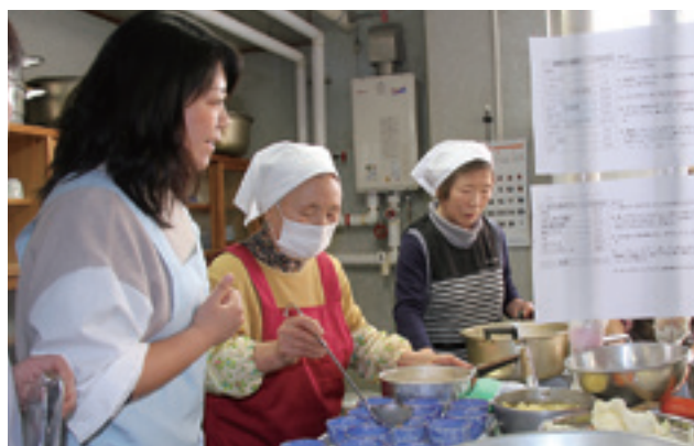
中山保健師とプリンを作る参加者