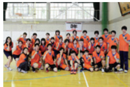
今年卒業する3学年の生徒たち

これからは、生徒自身がお道を選び開いていきます。与えられた状況を変えていくことも時には必要ですが、会社や大学などでのさまざまな出会い一つ一つをどう