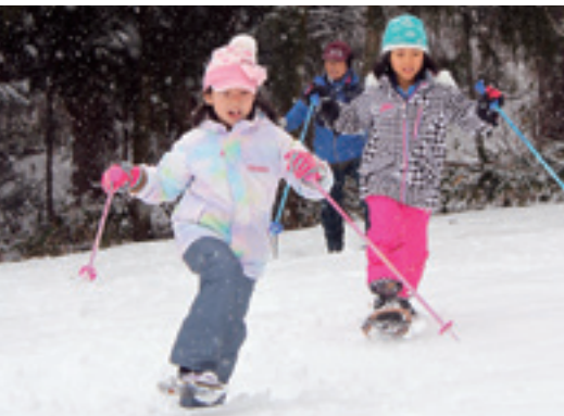
雪原でかけっこもしました