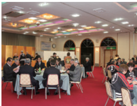
議員や消防団員など54人が出席