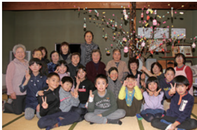
世代間交流をしました