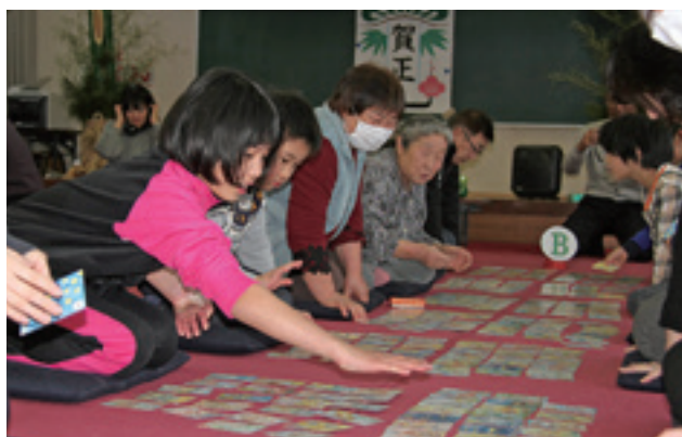
目と耳を駆使して札を取っていきました