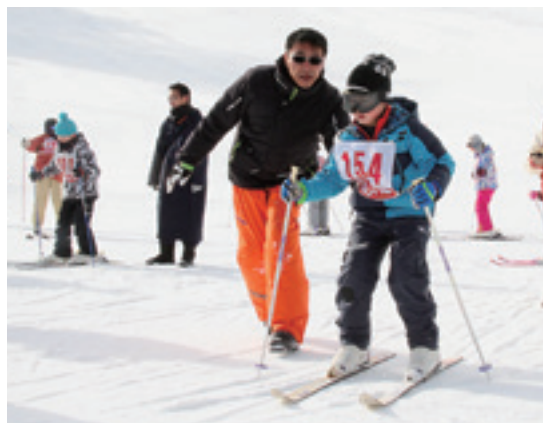
スキー学校の先生から指導を受ける児童

児童57人はスキー場で、スキーやスノーボードをして交流しました。初心者コースや中級コースなどに分かれ、ウインタースポーツを楽しみました。 初心者コースではスキー学校の先生を講師に、スキーの滑り方を一から学習。前に進む方法や横移動で坂を上る方法などを学びまし