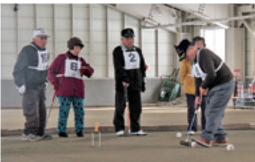
声を掛け合いながらプレー

ゲームは男女混合で行われました。どのようにショットを打てば高得点を目指すことができるのか、力加減はどうすればよいのかなど、チームで声を掛け合いながら、得点を競い合いました。