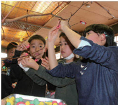
色とりどりのみずき団子を飾り付け