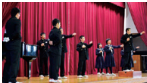
全校生徒を前に応援歌を披露

1月22日に本校で、応援団幹部紹介式が行われました。この冬練習を積み重ねた1年生の応援団が、新しく覚えた応援歌の手ぶりを全校生徒の前で披露しました。大きな声を出しながら指の先まで整えて手を振る姿に応援団としての決意が感じられました。また、全校生徒もそれにこたえるかのように大きな声を出し、応援団を支えました。