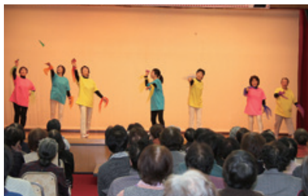
趣向を凝らしたステージも好評でした