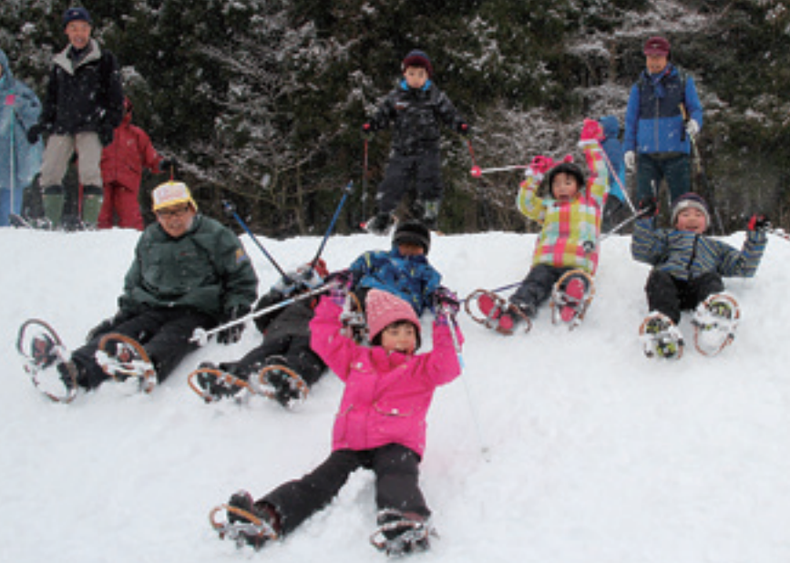
斜面を滑り下りる「ケツゾリ」に挑戦