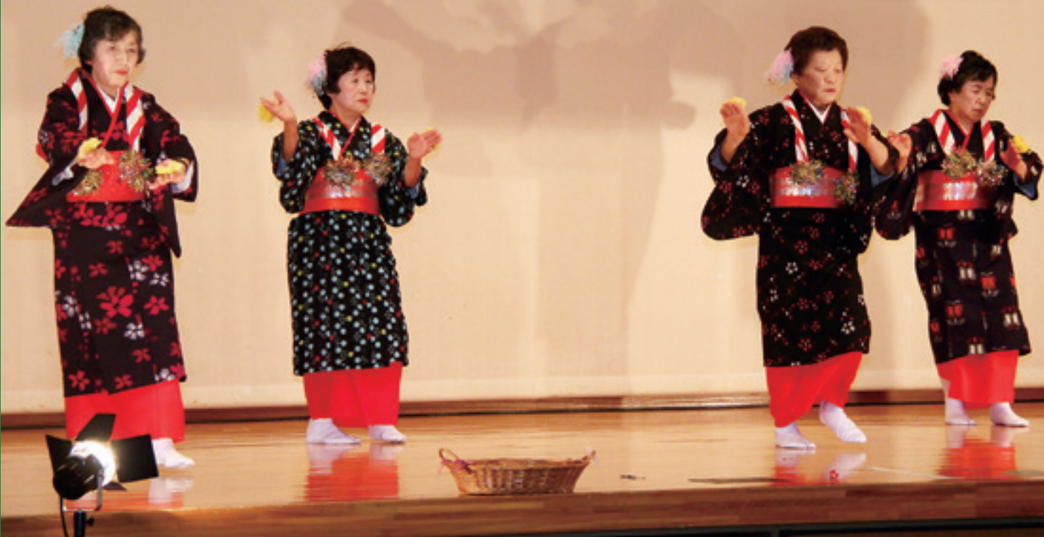
あでやかに踊った「どどさい節」(伊保内上老人クラブ)