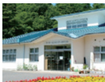
デイサービスセンターおつつめ

がちょっと熱を出したときにご飯を作って持ってきてくれたり、買い物をしてくれたり、留守を頼んだりなど、助けの手を差し伸べてくれる人はいらぬものです。特に認知症介護をしている場合は、隣近所の人・民生委員・駐在所・行きつけのお店など、お世話になりそうな人たちにあいさつをしておきましょう。 近所の人や地域とつながることは、介護者にとって実は一番孤独から救ってくれる力になりやすいのです。