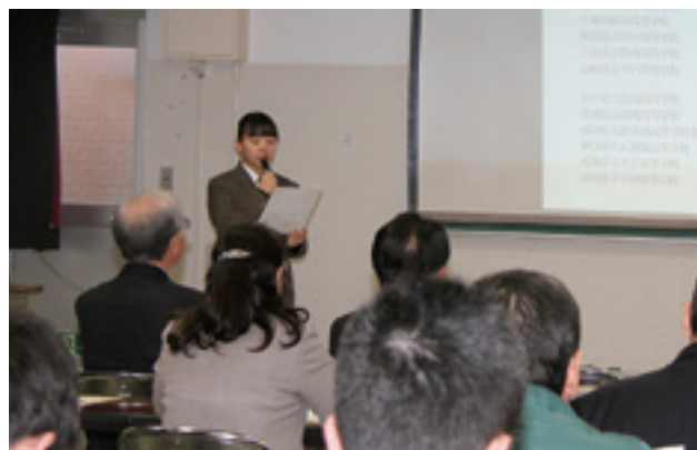
多くの傍聴者の前で堂々した発表をする生徒（報告会）