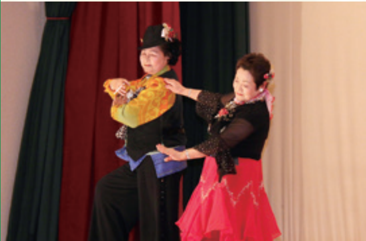
「秋田大黒舞」ではお菓子も配られました(伊保内下老人クラブ)