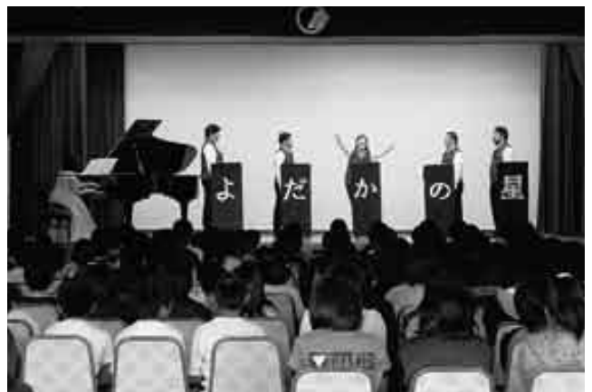
宮沢賢治原作の音楽詩劇「よだかの星」の講演