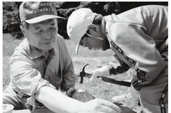
ほだ木への穴あけやコマ菌の植え方を体験する児童