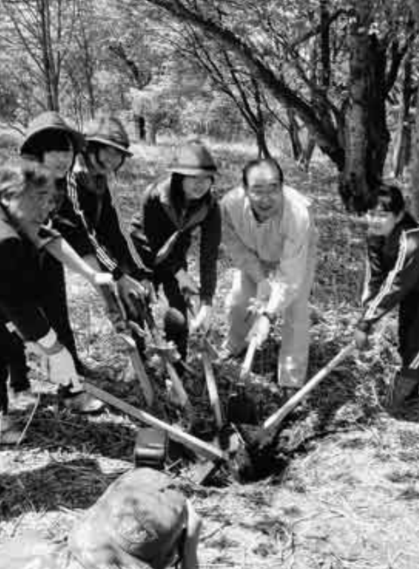
折爪岳山頂付近で苗木を植える参加者