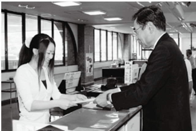
岩部村長から戸籍の全部事項証明書が手渡されました

6月14日、役場住民生活課で戸籍のコンピュータ化開始式が行われ、新しい戸籍証明の第1号となった方に、岩部村長から戸籍の全部記載事項証明書が手渡されました。これまでは届出を受け付けてから証明書の発行まで4日程度必要でしたが、コンピュータ化により2日程度での発行となるなど、迅速な処理が可能になります。（日数は届出により異なりますので窓口で確認ください。）