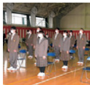
規模縮小の入学式