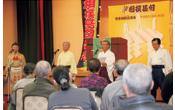
各講師による講座が盛りだくさん（相撲起源と甚句誕生）

◆申し込み・問い合わせは「教育委員会生涯学習班（☎ 42-2111 内線 305）」まで。