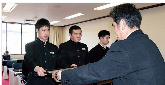
一人一人に賞状が手渡されました