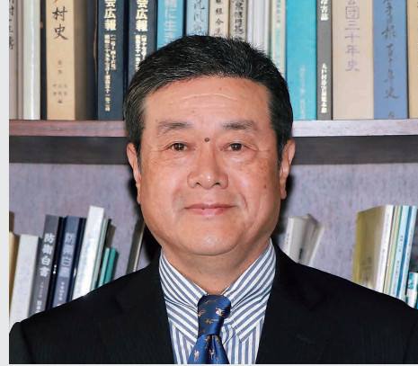
九戸村長 はれやま ひろやす 晴山 裕康