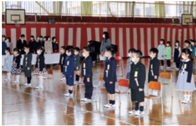
伊保内小学校に入学した13人