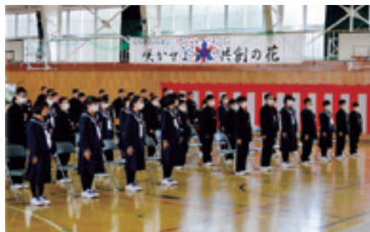
マスクを着用し式に臨んだ新入生

4月4日、本校の入学式を挙行了ました。新型コロナウイルス感染症対策のため、卒業式同様に規模を縮小し、来賓の来校を遠慮していただいたほか、座席間を明け、扉も開放し、3つの密（密接・密閉・密集）を避けながら行いました。新入生は、新しく始まる中学校生活に胸を膨らませ、元気に入学式を終えました。本年度は、応援歌練習を