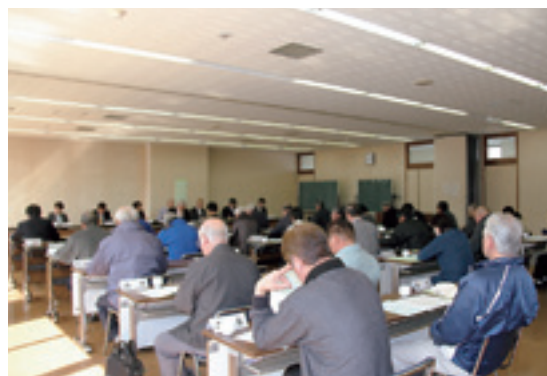
昨年開催された行政連絡員会議の様子

す。お気軽に声を掛けてください。 【主な活用法】 ▽地域行事への協力▽自治会総会資料作成などの補助 ▽地域から行政に対して、要望事項など担当機関への取り次ぎ