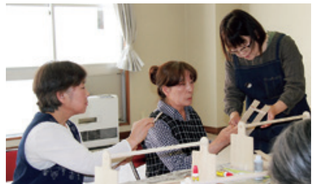
簡単にできるDIY講座（小物入れ作り）