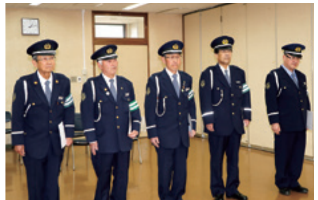
村の交通安全を守る交通指導隊員