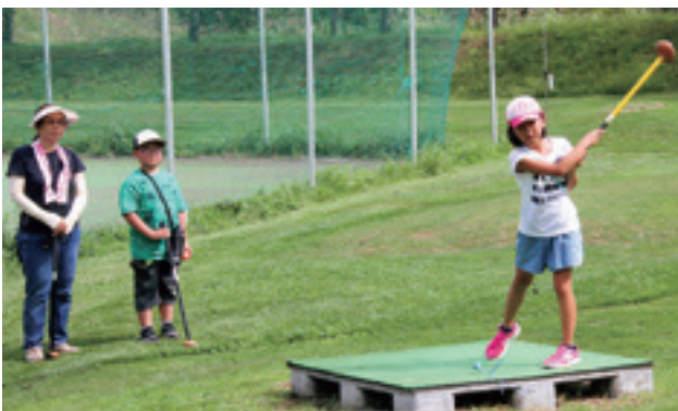
九曜塾の子どもたちとの交流（世代間交流）