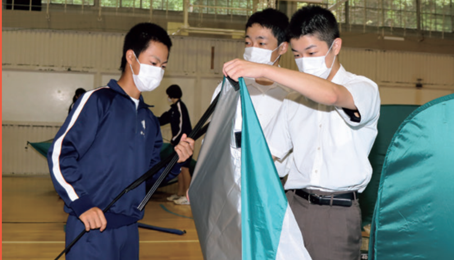
説明書を読みながらテントの屋根部分を組み立て