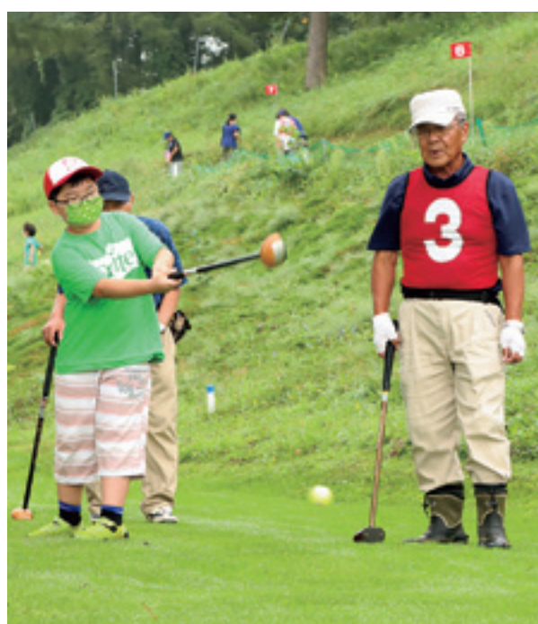
ボールの打ち方を指南する会員⑥と実践する児童