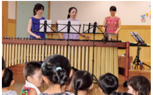
打楽器の音色が園内に響きました

いわてパーカッションニストの3人が同園を訪れ、「道化師のギャロップ」や「パプリカ」、「剣の舞」など11曲を演奏しました。中でもアニメ主題歌の「紅蓮華」で子どもたちは大盛り上がり。演奏を聴いた園児は、「アニメを見ているようで面白かった」と嬉しそうに話していました。