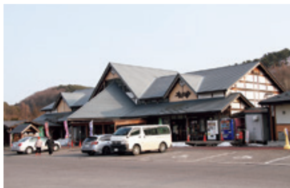
オドデ館の今後を一緒に考えましょう