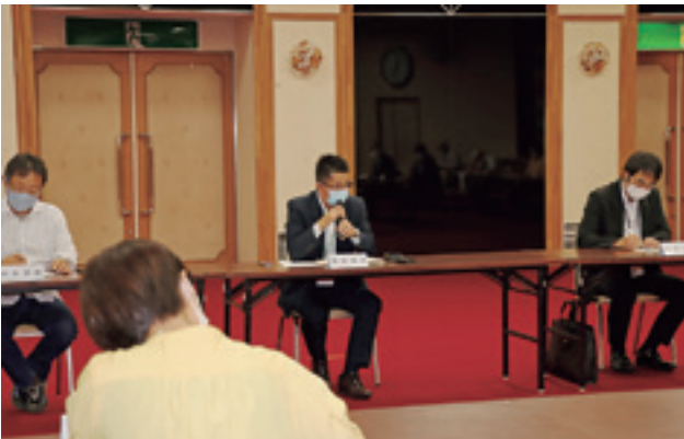
各分野からの意見が多く出されました