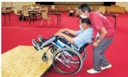
車いす体験をする参加者

間、九戸村生活支援有償ボランティア養成講座を行い、18人の住民が受講しました。これは、高齢者などのちょっとした困り事を解決するボランティアを養成し、いくつになっても住み慣れた地域で安心して生活できるように支援する新しい取り組みです。