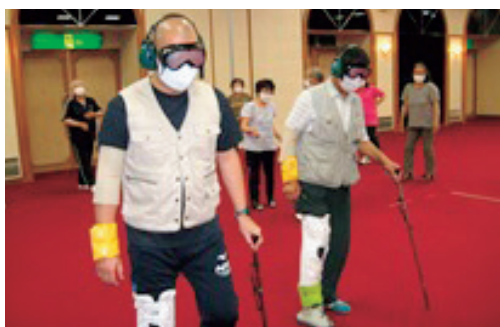
高齢者疑似体験も実施

有償ボランティアは、活動した時に「感謝の気持ち」のやり取りとして、少額の謝礼を受け取る活動です。助ける側と助けられる側の対等性（お互い様）の関係を育み、無償では逆に頼みづらいつという気持ちを受け止め、気軽に助けを求めやすい関係を築けます。また、