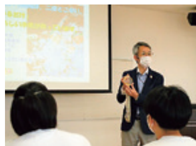
三ヶ田礼一さんの講話

本校3年生は、9月16日～18日まで2泊3日で修学旅行に行きました。新型コロナウイルスの影響で、旅行先を岩手県内に変更し、不来方高校の合唱、オリピック金メダリスト（三ヶ田礼一さん）のお話を聞いたり、宮古ではシーカヤックを経験したりしました。また、2年生は17