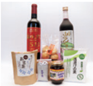
返礼品一例(7種の九戸満喫セット)

※確定申告の際には、寄附金受領証明書の提示が必要となりますので、大切に保管してください。返礼品は、村外の人が対象となります。