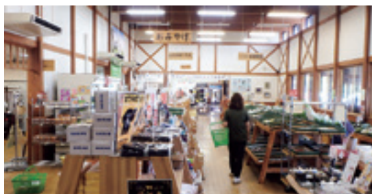
さまざまな農林産物が出荷されるオドデ館

九戸インターチェンジそばの道の駅おりつめオドデ館は、久慈市などに向かう車両の休憩場所として連日賑わっています。特に新鮮な野菜や花きなどの農林産物が大好評で、毎日の出荷を支えるのが九戸村内の生産者で組織する「オドデ館友の会」です。販売スペースには余裕がありますので、ぜひ入会し出品しませんか？