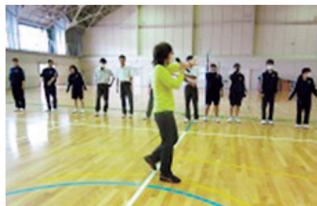
講師（中央）から講義を受ける生徒

授業の内容は、最初の授業2コマでグループごとに読書会の流れや、時間配分などの計画・準備を作成し、後半の2コマで小学生とのレクリエーション講習会を