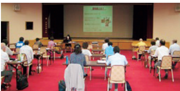
養成講座を熱心に学ぶ受講者

受講者は2日間にわたり、高齢者の身体と心の変化についての講義や、社会福祉協議会講師によるキヤップハンディ体験講座を熱心を受けていました。