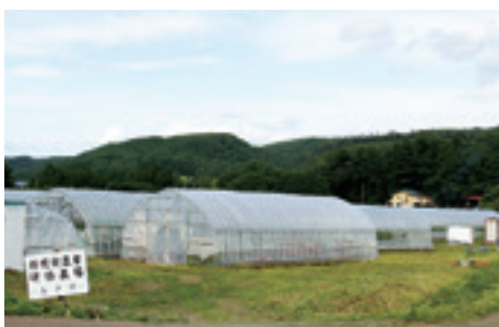
新規就農者研修農場