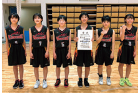
集合写真に収まる女子バスケットボール部員

県中学校新人大会のバスケットボール競技は、10月17日と18日の2日間行われ、九戸中学校の女子バスケットボール部が9年ぶりに3位入賞を果たしました。