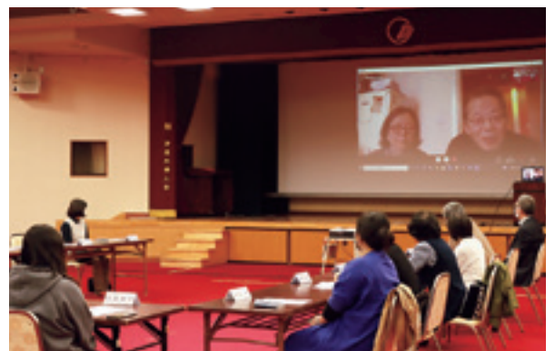
イギリスと中継をつなぎ懇談