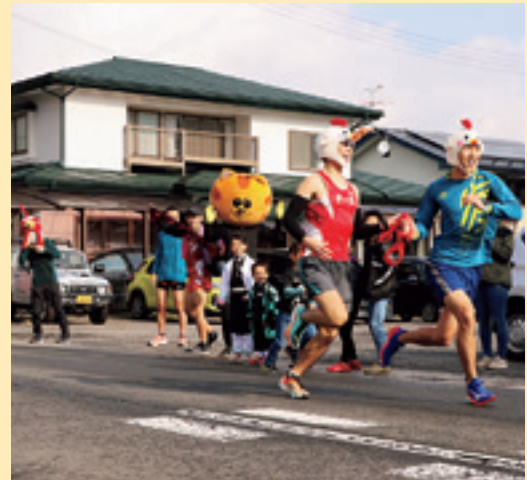
子どもたちの応援を受けタスキをつなぐランナー

丸木橋から旧宇堂口小学校までの21駅をタスキをつなぎながら疾走。村民からの応援を背にゴールを目指しました。最後の100mは、Mr.オブチキと浄法寺のねこ、応援隊の子どもたち全員でゴール。1時間13分13秒と、記録まであと27秒という結果になりました。