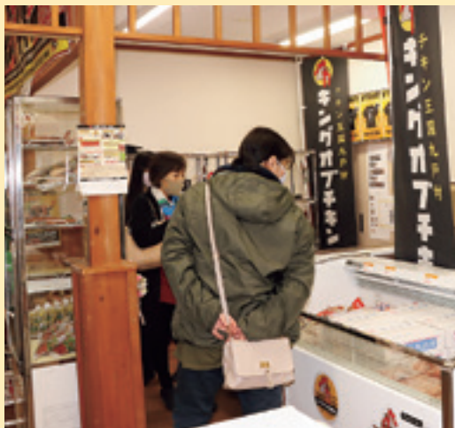
村内外から多くの人を訪れました