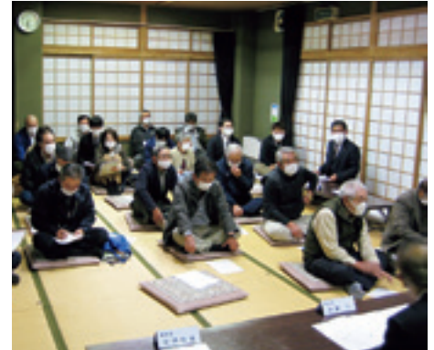
江刺家ふるさとセンター