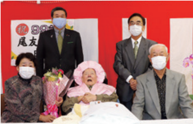
皆から祝福を受ける尾友さん (前列中)