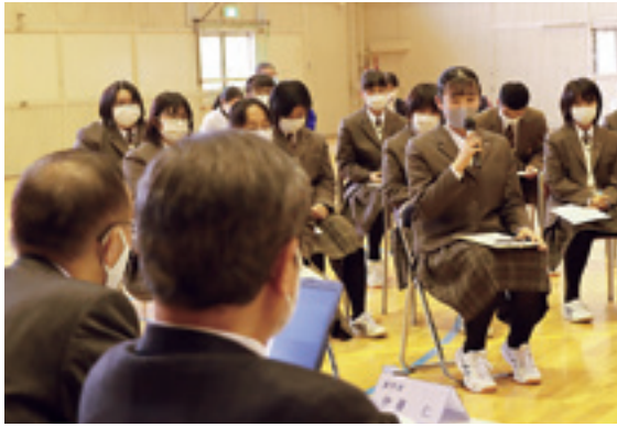
高校生の視点からさまざまな提案が発表されました

全9回のナインズミーティングで出されたこれらの質問や提案などは、今後の九戸村の政策に反映したいと思しますので、今後ともご意見、ご要望をお寄せください。