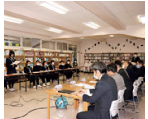
村に提案をする九戸中生徒会