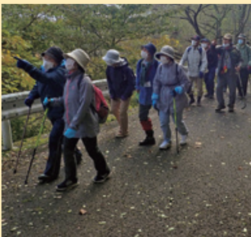
林道を歩く参加者

参加者には、この日のために作られたオブチキ特製てぬぐいや、鶏肉を使った弁当が手渡されました。