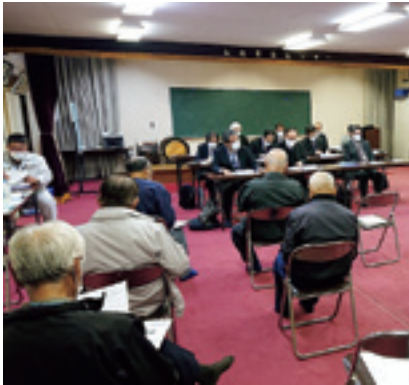
山根集落センター