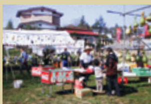
昔のひょうたん祭りの様子