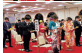
平成30年度村成人式の様子