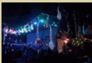
ひょうたん イルミネーション