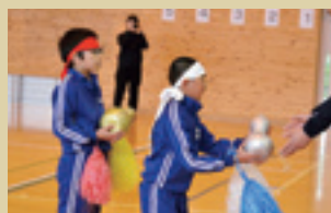
山根小学校で使用されている ひょうたんトロフィー