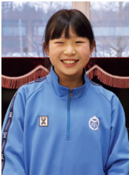
好きなピアノの前で撮影 「となりのトトロ」が得意です。