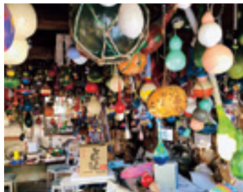
装飾したひょうたんがたくさんある部屋。迫力がすごい！！

あけましておめでとうございます。 2022年寅年、わたくし年女であります。 今年もよろしくお願ひいたします。 山根のひょうたんを取材させていただきました。