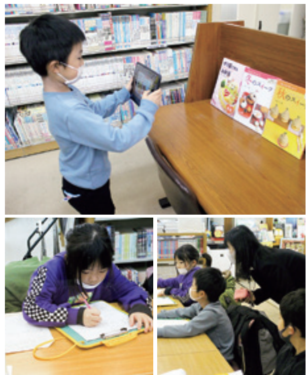
㊤ タブレットで絵本を撮影する小学生 ㊦㊧ 記録をとる小学生 ㊨㊩ 先生と一緒に学ぶ

11月30日、村公民館図書室で戸田小学校2学年の児童3人が生活科探検学習を行いました。ICT（タブレット端末）を活用し図書室内の様子等の記録を取り、真剣な眼差しで学習しました。子どもたちは「39,217冊の本や郷土資料（昔の着物）があるなんてびっくりした」「たくさん借りて知りたいことを調べてみたい」と話しました。