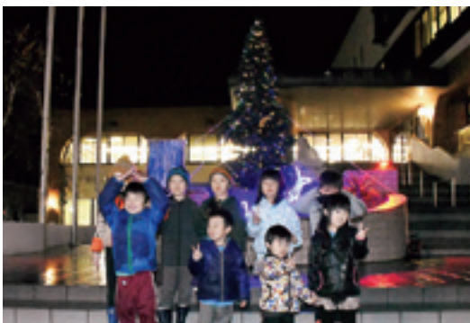
光るツリーの前で笑顔をみせる子どもたち

12月1日、村国際交流協会は、村役場庁舎前の噴水跡地に設置したクリスマスツリーの前で点灯式を行いました。千葉利夫会長は「クリスマスツリーが元気を与え、村の活性化につながれば良い」と話しました。カウ ントダウンに合わせて地域子どもたちがイルミネーションのスイッチを押ししました。点灯期間は12月1日～12月26日の午後5時～9時。一部照明は自動消灯します。