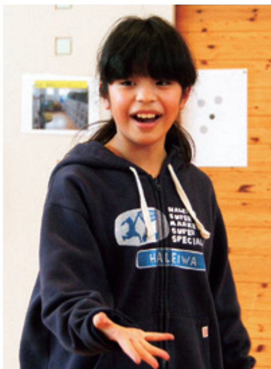
線おにの鬼決めジャンケン中