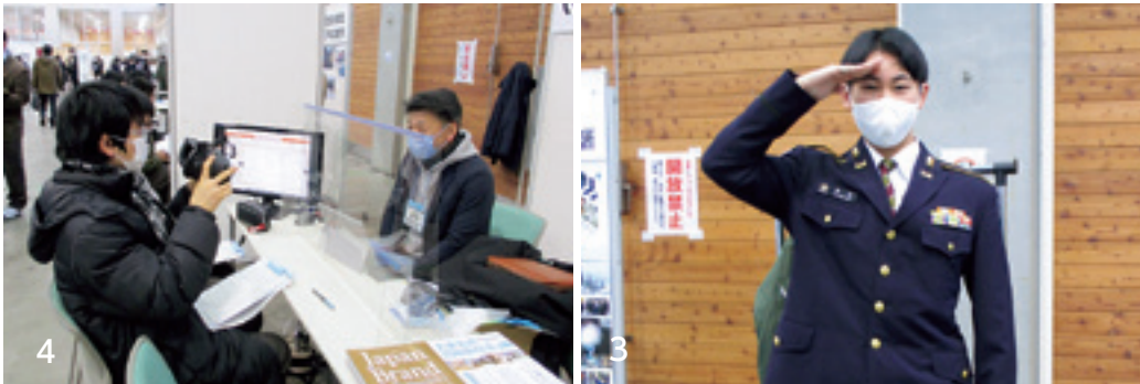
1_ 消防の仕事について説明を受ける伊高生 2_ 普段乗れない白バイにまたがる生徒 3_ 自衛隊の制服を着用すると身も引きしまる 4_ 村内企業の現場の様子をVR映像から学ぶ

1月19日、伊保内高校の1・2年生30名はカシオペアメッセなりにヤーとで行われた「カシオペアしごとメッセ」に参加しました。地元での就職を検討する機会として、二戸管内の高校生を対象に、地元企業が商品やサービス、事業内容をPRしました。九戸村からは4社が参加しました。イベントでは、就職した地元の先輩の体験談を聞き、各ブースで道具に触れながら説明を受けました。生徒たちにとっては、今後の進路選択のための貴重な体験となりました。