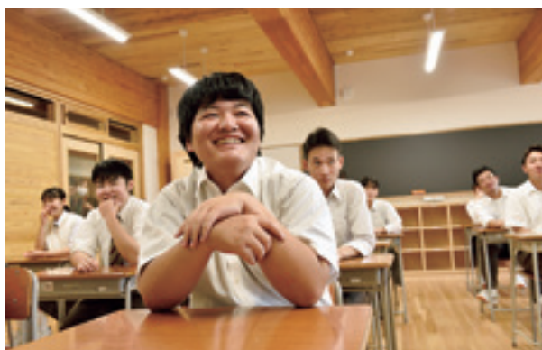
村は伊保内高校を全面的にバックアップしています

村の子ども手当を就学前児童には月額2千円、小学生児童には月額3千円、中学生には月額4千円支給します。