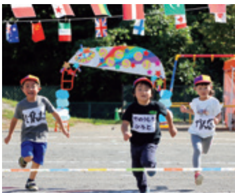
ゴールに向かって全力疾走する徒競走の様子

園児数が少ないからこそ、学年によって障害物競走のステージを変えたりなど1つの競技でも多彩な変化があり、中でも最年長のひまわり組は登り棒を使った高度な競技にチャレンジしました。