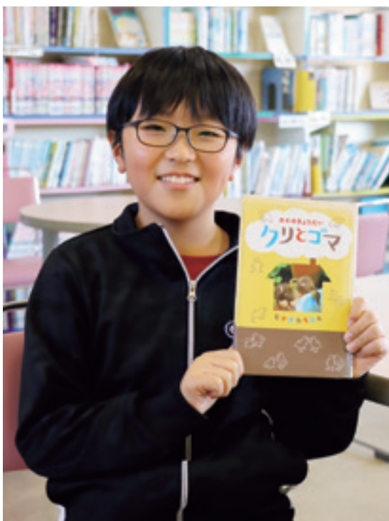
おすすめの本はかわいいカモが出てくる「クリとゴマ」