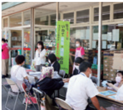
脳卒中予防のために高血圧、肥満の改善アドバイスをを行うスタッフ

9月30日、スーパーおともで「いわて減塩・適塩の日」として脳卒中予防活動が行われました。