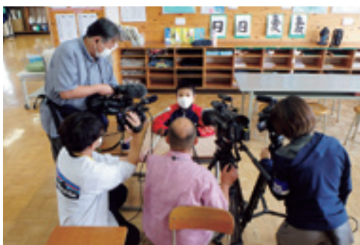
⑥ふわふわのもち姫食パンを食べる児童 ⑤県内初の試みというところもあり多くの報道陣が取材に訪れました