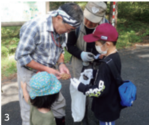
1 松茸をとった児童 2 採ったキノコを観察する 3 キノコを選別する山友会のみなさん