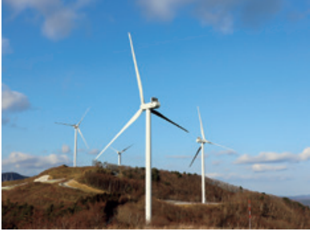
完成したJRE折爪岳南第1風力発電所

この風力発電所で発電した電気は、一戸町にある変電所を経由して東北電力ネットワーク様の送電網に送電されます。送られた電気は、送電網全体で調整され使用されますので、九戸村で使われていると言っても間違