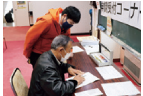
役場では特設ブースを設けるなどマイナンバーカード取得を積極的にサポートしています

マイナンバーカードがこれから保険証になると聞いて申請を決断しました。もっと手続きが難しいと思っていましたが、とても簡単で、これならもっと早くにしておけばよかったと思います。