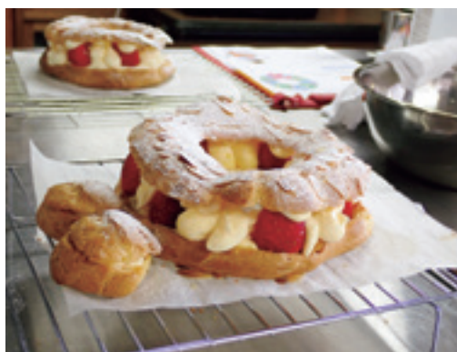
①親子で楽しくお菓子作り