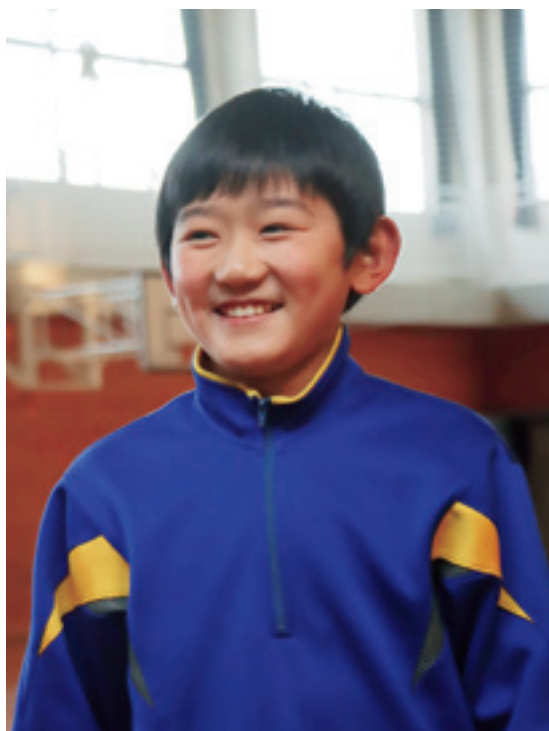
よく走り回るといふ体育館で撮影