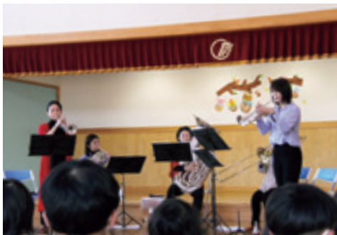
イーハトーブ・ブラス・クインテットの生音の迫力ある演奏

演奏会ではクラシックや映画音楽、ジャズ、アニメ音楽など様々なジャンルで演奏が行われました。園児たちは知っている曲が流れると、声をあげ興味をもって演奏に耳をかたむけました。