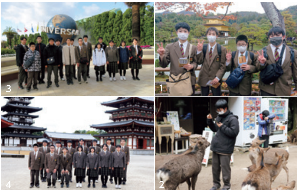
1 金閣寺を背景に仲よし 4 人組で撮影 2 奈良公園で恐る恐る鹿に餌やり 3 USJのシンボル、地球儀の前で集合写真 4 薬師寺での集合写真