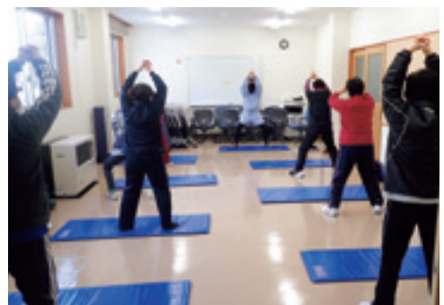
ストレッチで心地よい汗を流す参加者