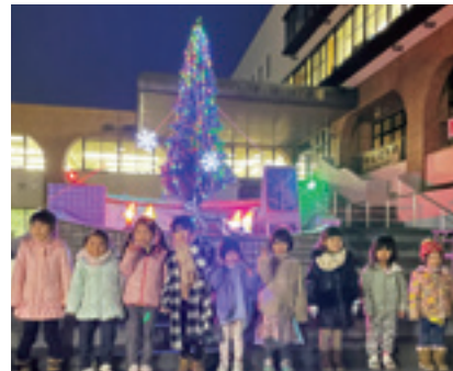
点灯したクリスマスツリーと参加した園児たち