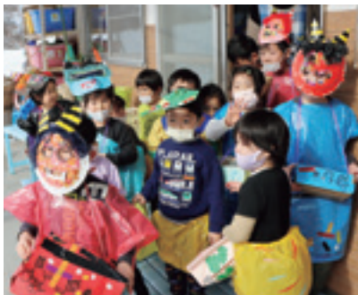
節分行事(ひめほたるいごも園)

最近、少子化対策・子育て支援のニュースをよく目にします。国が少子化対策に本腰をあげることを大いに期待するものですが、既に、九戸村では子育て支援施策の充実に取り組んできました。