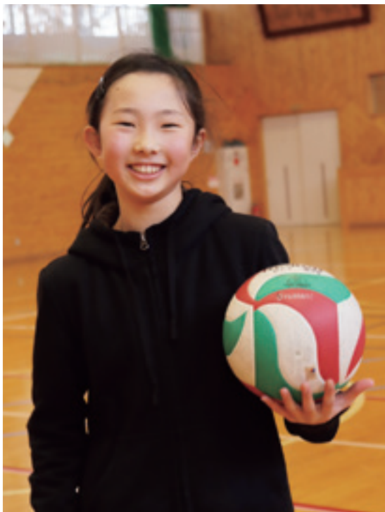
週3で手にしているバレーボールと撮影