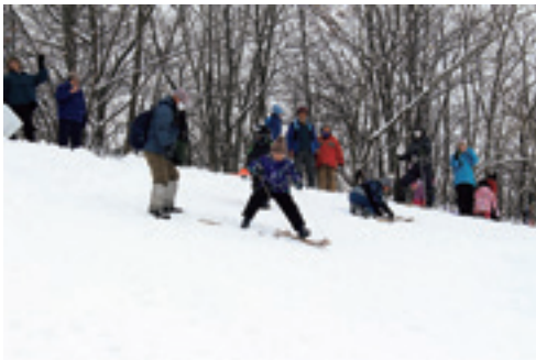
㊦かんじきをはいて出発 ㊧休憩は雪の上に寝転んでみよう ㊨手作りの竹スキー体験