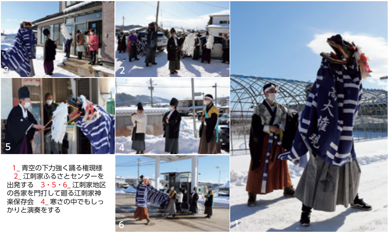
1_ 青空の下力強く踊る権現様 2_ 江刺家ふるさとセンターを出発する 3・5・6_ 江刺家地区の各家を門打して廻る江刺家神楽保存会 4_ 寒さの中でもしっかりと演奏をする