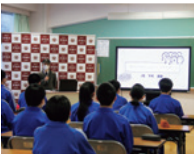
事業説明する伊高村おこし会社

にとつては、気軽に参加して相談しやすい環境があるので、大変お世話になっていきます。