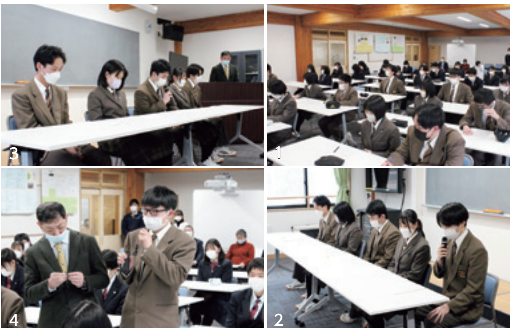
1 進路報告会に参加する1・2年生 2 3 受験対策や取組みと共に後輩にエールを送る3年生 4 来年度に向け、より詳しく質問をする2年生