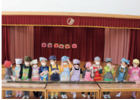
⑥鬼に豆をまく子供たち⑦ひめほたるこども園では恵方巻も子供たちで手作りしました