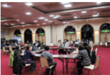
チームに分かれて感想を交換