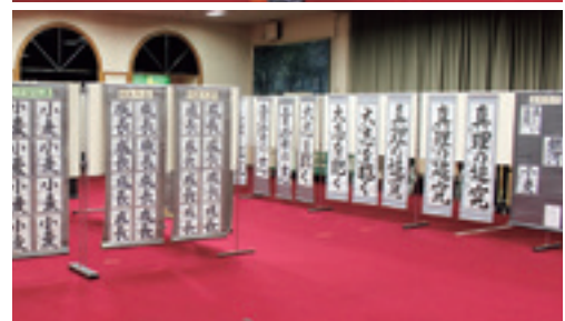
作品展の様子（HOZホール）