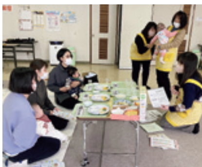
村主催の離乳食教室

ます。特に大学費用は、心配しています。 【保護者Bさん】子どもが遊べる公園や交流できる場が欲しいと思います。学費などの費用がかかるので、できれば子ども手当を増やしてほしいです。 【横井信香保健師】私は今、2人目を出産し育休中です。さまざまな手当のほか、保健センターの幼児向けの教