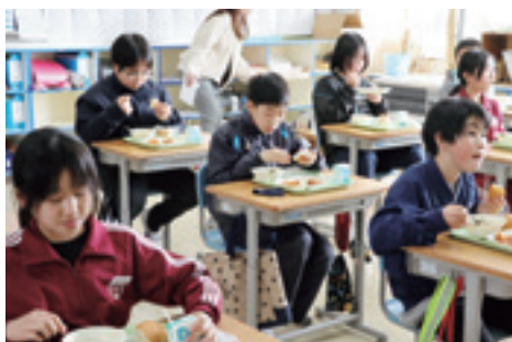
無料で提供される学校給食

も行っています。そして、九戸村独自の子ども手当も開始しました。中学生月4千円、小学生月3千円、未就学児月2千円を給付する制度です。