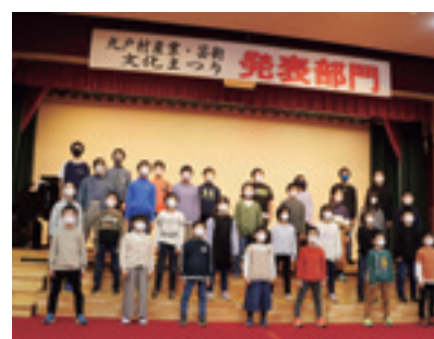
産業まつりで合唱をする児童

保育の整備、③働き方改革として子育て中の働く人への支援や長時間労働の是正などの3本の柱を中心に施策を検討しているようです。 今後、国の子育て支援の充実をぜひ期待するとともに、村としては、地域の実情に即しながら、国の施策を補えるような少子化対策を充実させていきたいと思っています。