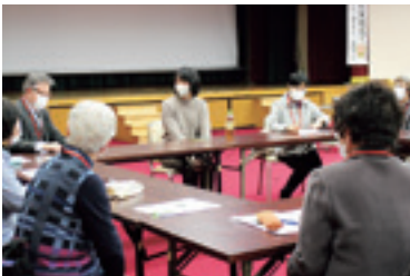
思わぬことを聞けてうれしかったです！