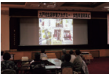
ところどころザワツとなりました