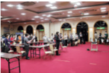
村民歌はじめて聞きました！