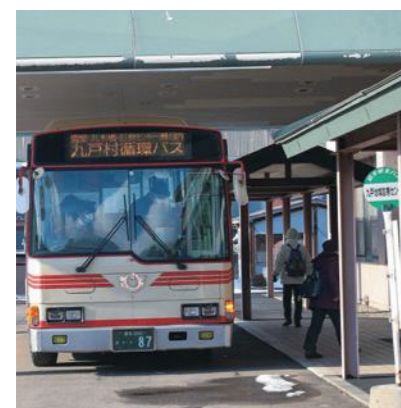
平成17年度から運行されている九戸村循環バス。九戸地域診療センター利用者からのデマンド交通導入に向けたヒアリングでは、「循環バスは待ち時間が長い」などの声も出されている

車いす利用には車両改造が必要となるほか、介護資格者の乗車や許認可も必要であり、バス運行事業者が行う公共交通の範囲を超えてしまう。予約システムは、使いやすいことが大事であり、担当部署に指示している。バス料金の無料対象者拡大に関しては、検討事項とさせていただきます。