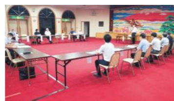
活動方針などを協議した第1回統合準備委員会=8月8日

教育長 複式学級においては、工夫を凝らした丁寧な授業が行われている。しかしながら、国が目指す「協働的な学習」という面においては、授業内での協働的な学びの場が限定される。統合により、こうした現状の問題点を解決することが可能になると考えている。