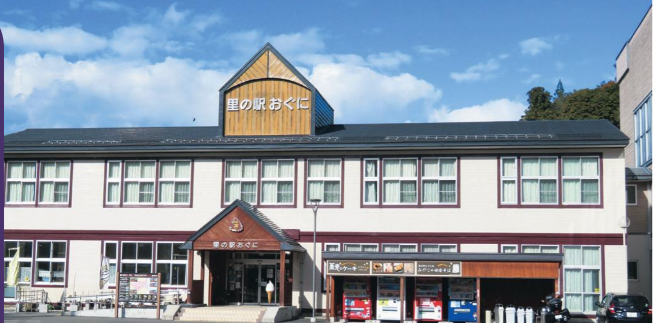
閉校となった小学校の校舎を再利用して整備された「里の駅おぐに」

盛岡市の認定NPO法人インクルいわては、ひとり親と子どもが楽しく健康で文化的な生活を自ら歩むことができる包摂された社会を目指し、ひとり親世帯と地域住民を対象とした就業支援事業、生活支援事業、地域連携事業などを行っています。 ▼令和4年度自主事業の実績 ①子ども食堂②シングルマザーの包括的支援(インクルすてーしょん、就活支援、親子の生活・物資支援)③年末年始応援(一緒におせち)④企業との連携事業(被災地との交流)