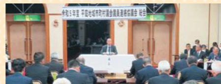
平庭地域市町村議会議員連絡協議会総会