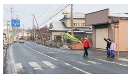
登校する長興寺小学校の児童

園 国道340号長興 寺上地区の歩道整備事 業の今後の実施は、ど うなっているか。 整備に当たっては、一 戸口交差点付近の事故 を防ぐため、右折レー ンを設ける必要がある 。県に強く要望する べきではないか。