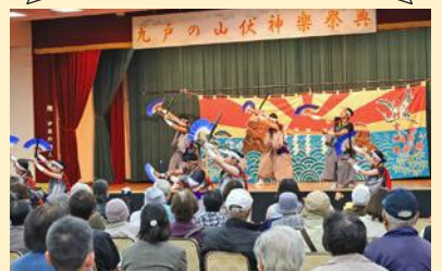
表紙の写真は、「九戸の山伏神楽祭典」で江刺家神楽を披露する伊保内高校郷土芸能委員会の皆さんです。奏楽の調べにのせ、ひた向きに舞う姿に会場から感動の拍手が送られました。