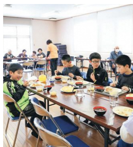
九戸村食生活改善推進員協議会和細屋サロンが世代間交流を目的に開催した「こども食堂」=12月25日、細屋ふれあいセンター

村長 学校再編に関する調整が図られた事項は▽指針により教育委員会が再編に向けて取り組む▽進めるに当たっては、「村民の声にしっかりと耳を傾ける」の2点である。このことを前提として、会議で決めたことを進めていくこと