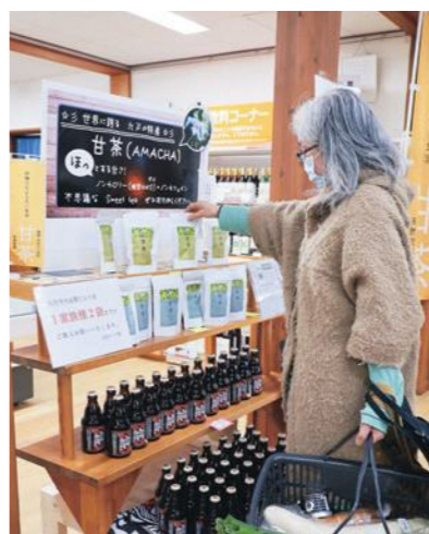
需要が高まっている甘茶。オドデ館では、「1家族2袋まで」と制限して販売されている=オドデ館

しかしながら、甘茶を一気に増反することは、かなり厳しい。これまでも研究機関の協力を