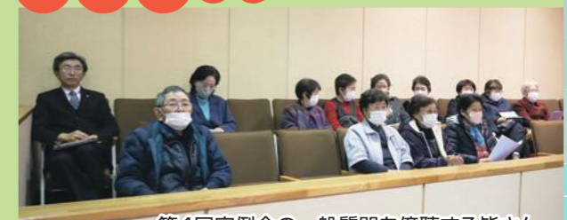
第4回定例会の一般質問を傍聴する皆さん

議事を傍聴してみませんか? 議員が議会でもどのような発言をしているのか。 村がどのような施策を行おうとしているのか。 一度、議事を傍聴してみたいかでしょうか。