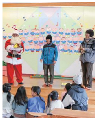
手作りの「木のおもちゃ」をプレゼントして保育園児と交流する地域おこし協力隊員ら

地域おこし協力隊員の任期は、最長3年と定められています。しかしながら、コロナ禍により、任期中に十分な活動ができなかった隊員(令和元年度から3年度までの任用者に限る。)を対象に、隊員が3年を超える活動を希望し、受け入れ自治体が「任期の延長が必要」と認める場合には、任期延長の特例を認めるものです。