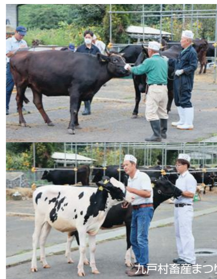
九戸村畜産まつり